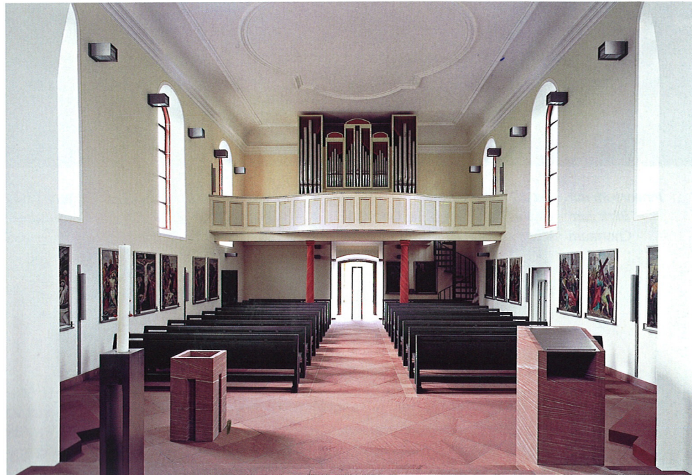
Blick aus dem Chorraum zur Orgelempore