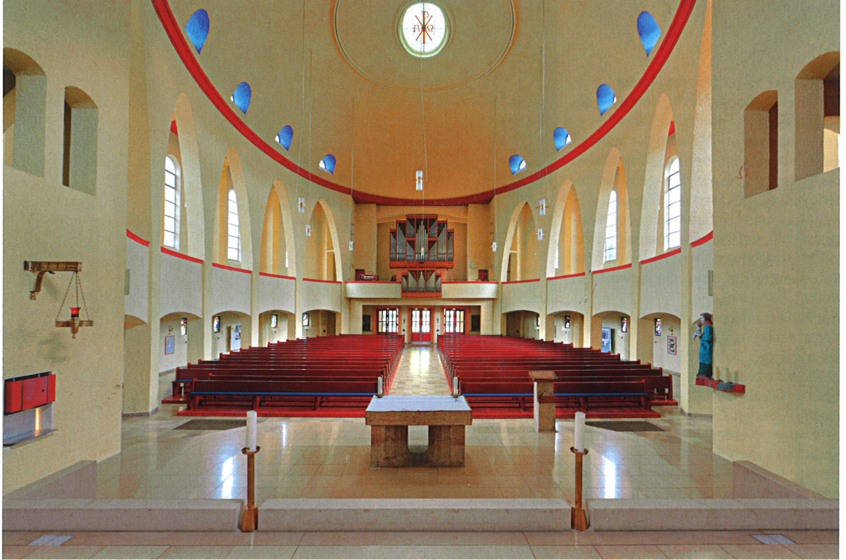
Blick aus dem Chor in den ovalen Kirchenraum