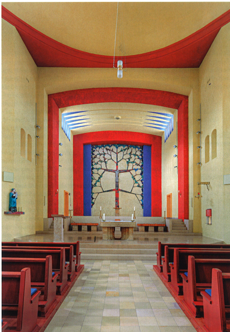
Chorraum mit „Lebensbaum“ von Wilhelm M. A. Müller