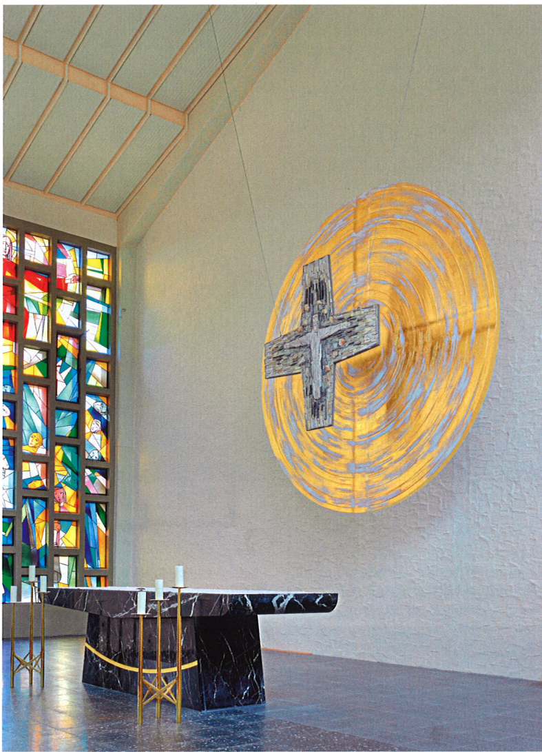
neu gestalteter Altarraum