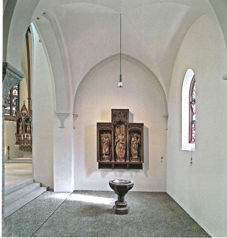
Taufort im rechten Seitenschiff

Die Bodenzone des Mittelschiffes und der beiden Seitenschiffe entstand während der Renovation der 70er Jahre. Aus Kostengründen wurden an den Verkehrsflächen aus feinkörnigem Waschbeton und den Gestühlsböden aus Wengé-Stabparkett nur Instandsetzungs- und Ergänzungsarbeiten durchgeführt.