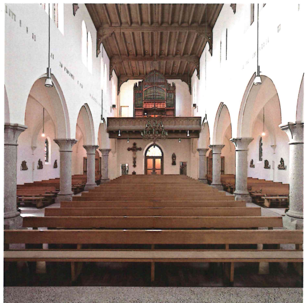
Blick vom Altarbereich zur Orgelempore